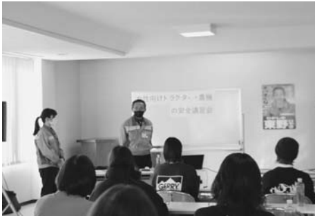
株北海道クボタ職員

2月10日、農業会館大会議室で株式会社北海道クボタによる女性農業者向けの農業作業安全研修会が開催され、14名が参加しました。研修会は、農作業死亡事故の状況について、就業者10万人当たりの死亡事故者数は増加傾向で他産業に比べて高い状態が継続しており、要因としては「農業機械作業に係る事故」が最も多く、次いで「熱中症」が多くなっているとの説明から始まりました。 その後、死角距離確認や自動操舵安全確認などの動画が視聴できるホクレンア