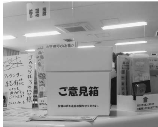
上浦幌支所のご意見箱