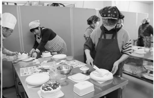
ケーキ作り体験の様子