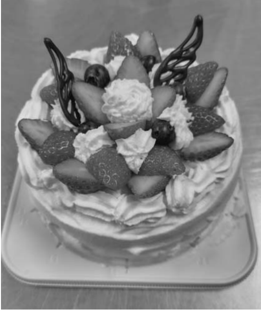
デコレーションケーキ