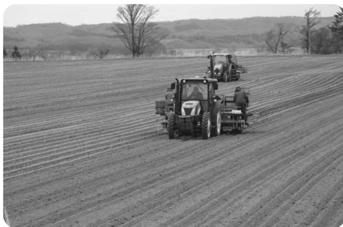
【豊北地区 移植ビート播種作業】