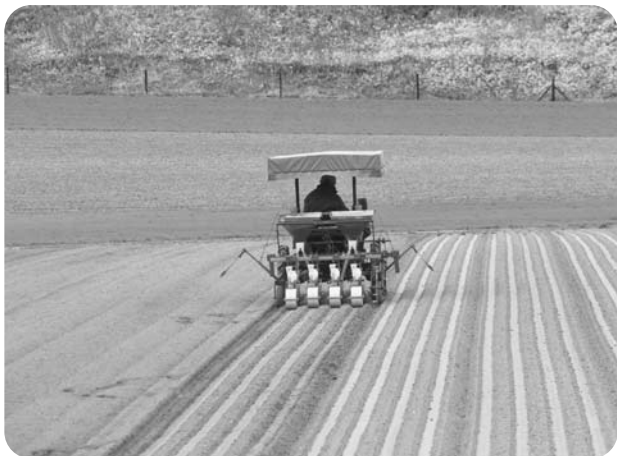
【相川地区 直播たまねぎ播種作業】