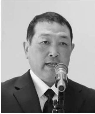
挨拶する越坂組合長

令和5年度事業報告並びに収支決算の承認及び監査報告、令和6年度事業計画（案）並びに収支予算（案）、令和6年度組合員負担金の賦課及び徴収方法について協議され、全議案が原案通り可決されました。 また、総会開催前に令和5年度優良牛群共励会の表彰が行なわれ、下記の方々が表彰されました。