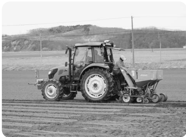
【宝生地区 澱原ばれいしょ播種作業】