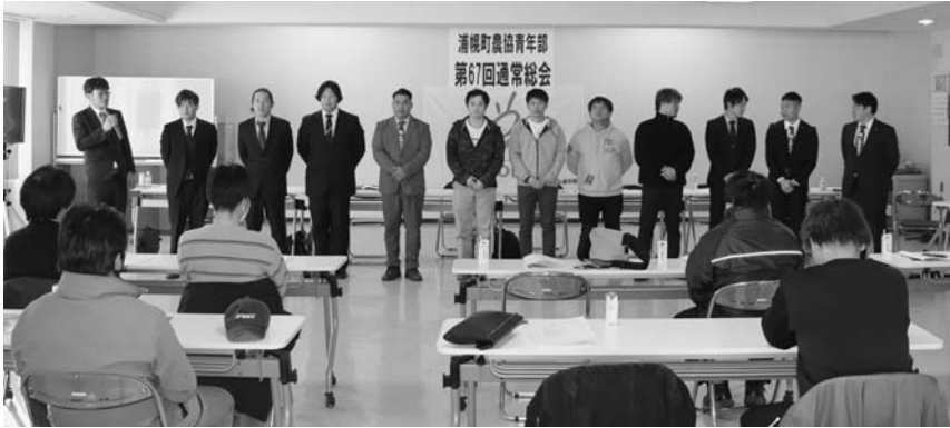
新旧役員挨拶の様子