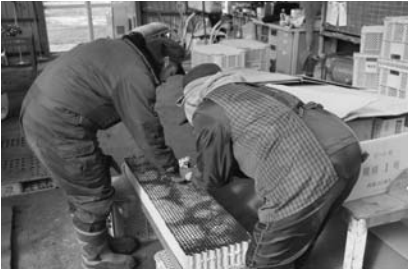
ポットの点検作業の様子