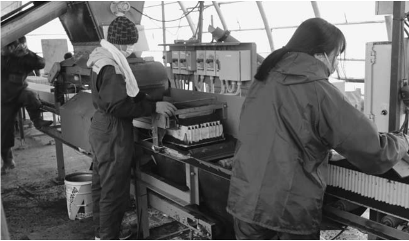
土詰め作業の様子