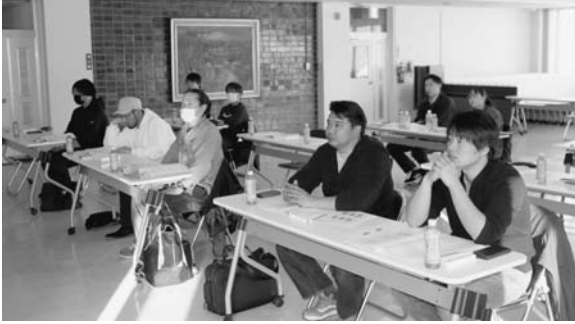
施防協試験総括の様子