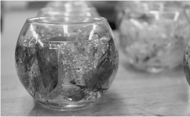
完成したジェルランタン

2月15日、令和5年度JAうらほろ女性冬期研修交流会を開催し、女性農業者8名と役員3名が参加しました。今回の研修は、Natural Aroma lifeの本間氏を講師に迎え、とちぎプラザでジェルランタン製作体験を行いました。 ジェルランタン製作体験では、様々な色のドライフラワー・ブリザーブドフラワーから自分の好きなものを選び、ガラス容器にバランスを考えながら配置し、講師の方が溶かしたジェルを流し込んで完成となるため、参加者はどの色の花を使うか迷いながらも彩り豊かな自分だけのジェルランタンを完成させていました。