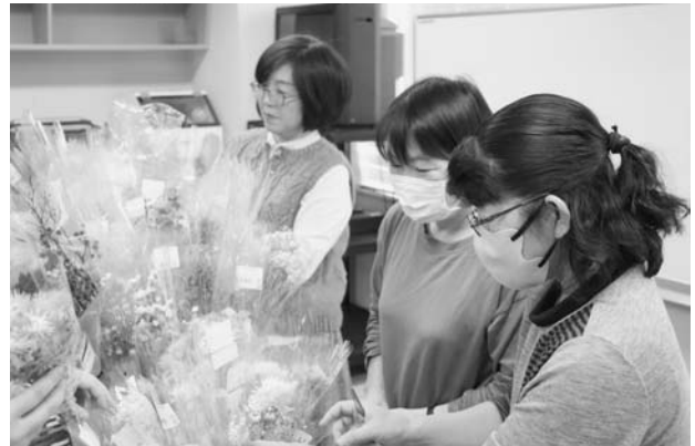
装飾を選ぶ参加者