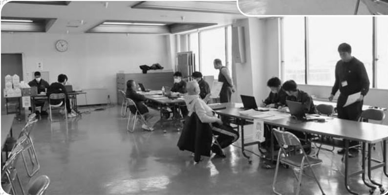
2024 営農計画相談(上浦幌地区) 【開催日：令和6年1月15日(月)~ 17日(水)】