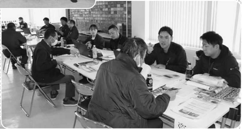
2024 営農計画相談(本所地区) 【開催日：令和6年1月18日(木)~ 22日(月)】