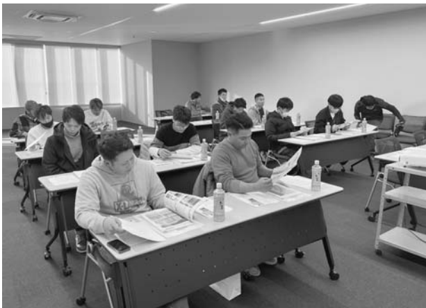
北日本スカイテック(株)での研修の様子