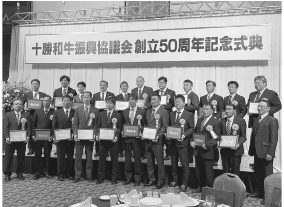
表彰された全共功労者ら