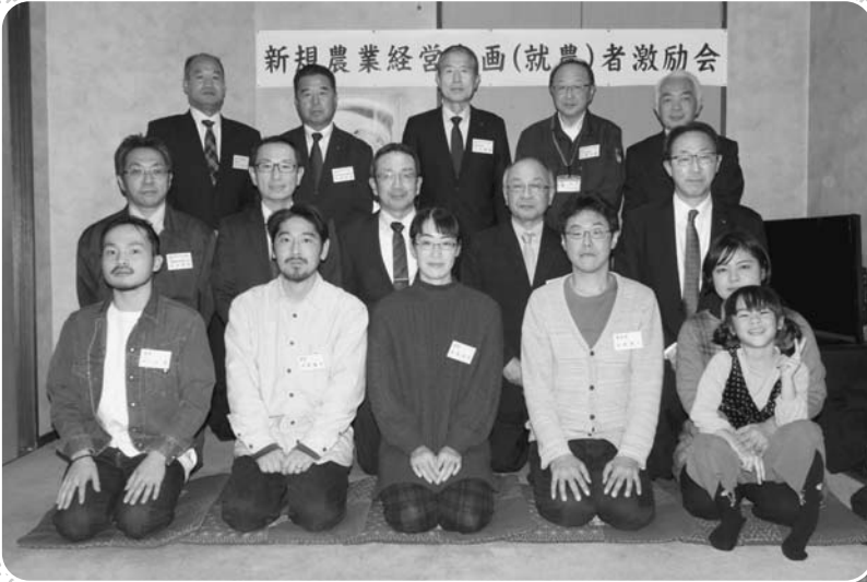
新規農業経営参画(就農)者 激励会 【開催日：令和5年12月14日(木)】