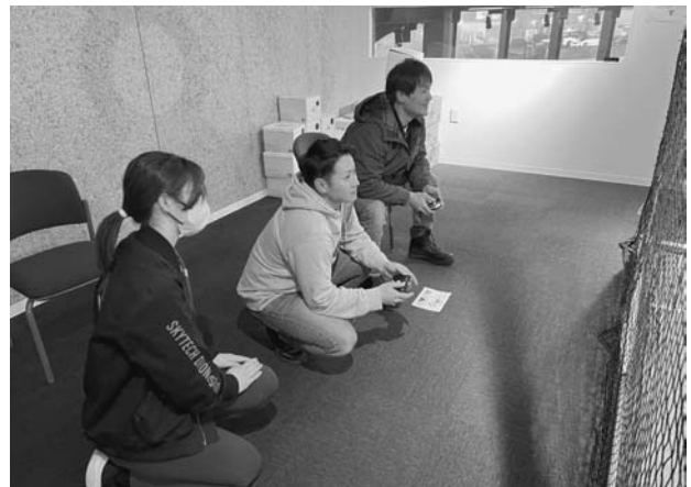
ドローンサッカー体験を行なう盟友