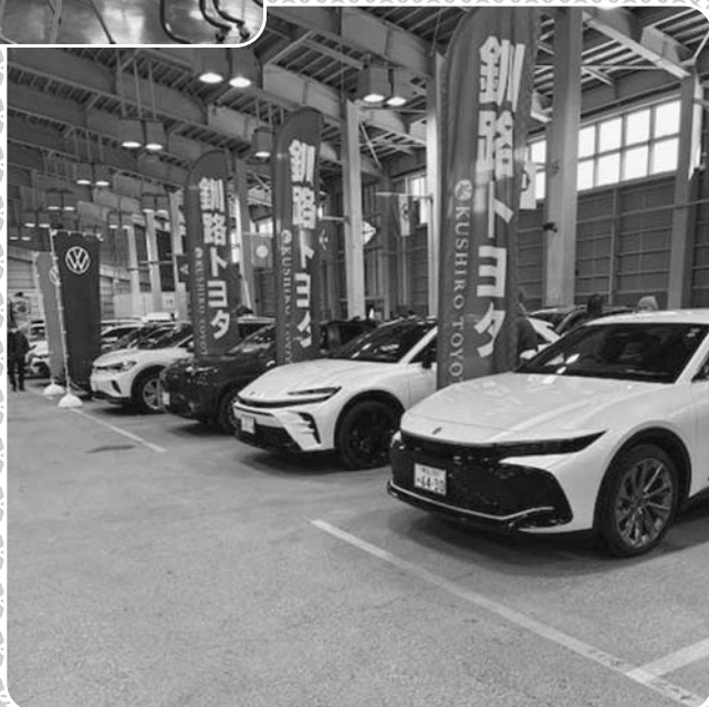
ニューイヤーモーターショー 【開催日：令和6年1月27日(土)~28日(日)】