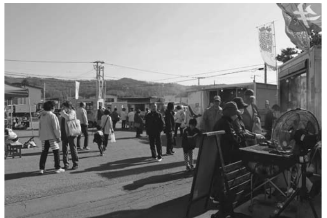
来場者で賑わうキッチンカー

飲食コーナーでは昨年より、キッチンカーに出店を依頼しております。今回は十勝産牛肉を使用したステーキ牛丼販売の「肉と米」、SNS映えのするクレープ販売の「crepe misora（クレープミソラ）」、浦幌産のタコを使用したたこ焼きを販売する「神だこ」、浦幌木炭を使用し、香ばしく焼いた若どりレッグが売りの「みさき食堂」、豊頃町大津の海産物を使った具材と、当麻町のこだわりのユメピリカを使ったおにぎり販売する「おにぎり屋風」のキッチンカー5台に出店していただきました。どのキッチンカーも人気で大盛況でした。