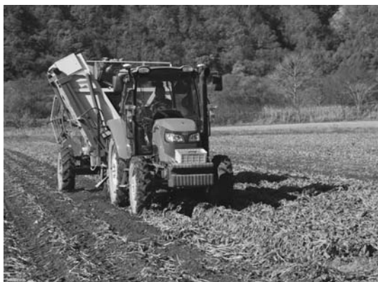
ビート収穫の様子

北海道糖業(株)担当者は「9月以降涼しい気温が続き、早期からの徹底した防除で昨年よりも褐斑病が抑えられているため、今年は収量や糖分が期待できる」と述べました。