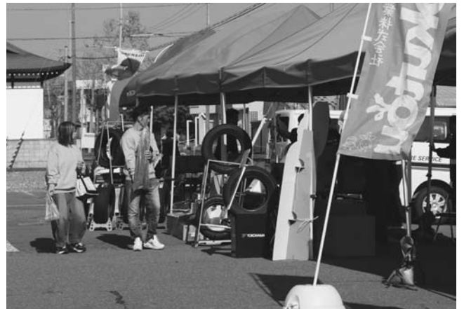
タイヤ販売コーナー

飲食コーナーでは昨年より、キッチンカーに出店を依頼しております。今回は十勝産牛肉を使用したステーキ牛丼販売の「肉と米」、SNS映えのするクレープ販売の「crepe misora（クレープミソラ）」、浦幌産のタコを使用したたこ焼きを販売する「神だこ」、浦幌木炭を使用し、香ばしく焼いた若どりレッグが売りの「みさき食堂」、豊頃町大津の海産物を使った具材と、当麻町のこだわりのユメピリカを使ったおにぎり販売する「おにぎり屋風」のキッチンカー5台に出店していただきました。どのキッチンカーも人気で大盛況でした。