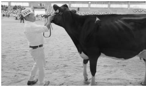
サニーライズ ハツピー ラム エクストリーム

9月28日、北海道ホルスタイン共進会場（安平町）で2024北海道ホルスタインナショナルショウ（主催：北海道ホルスタイン農業協同組合）が開催され、ホルスタイン337頭、ジャージー27頭、ジュニアカップ26頭の計390頭の出陳がありました。浦幌町からは、8月27日に開催された第53回十勝総合畜産共進会の結果により出陳が決まりました（株サニーライズ（活平）所有の「サニーライズ ハズ イット エルゲルージ」号が第2部、「サニーライズ ハツピー ラム エクストリーム」号が第13部に出陳しました。