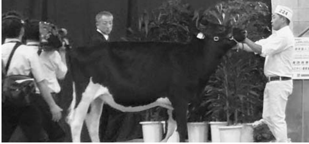
サニーライズ ハズ イット エルゲルージ