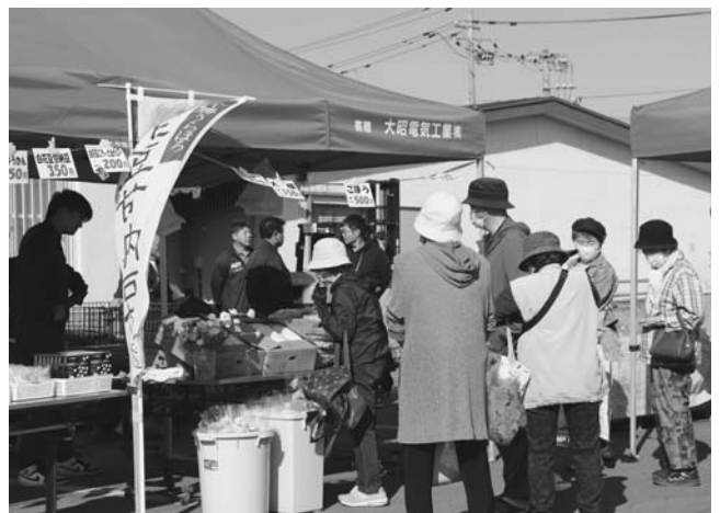
農産物コーナーの様子