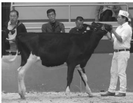
サニーライズ ハズ イット エルゲージ