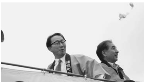
みのり播きを行なう林組合長

9月22日、うらほろ森林公園(町内東山)で第49回うらほろふるさとみのり祭り(主催・浦幌町観光協会)が開催されました。会場には町内の特産物を販売する店や飲食店が約40店舗並びました。当日は肌寒くあいにくの曇り空で雨が降る場面もありましたが、十勝管内外から約3万人(主催者発表)が来場しました。浦幌町の特産物があるスタンプラリーやみのりまき(餅まき)、秋あじのつかみ取りが行われ、みのりまきでは合計3万個のもちが撒かれま