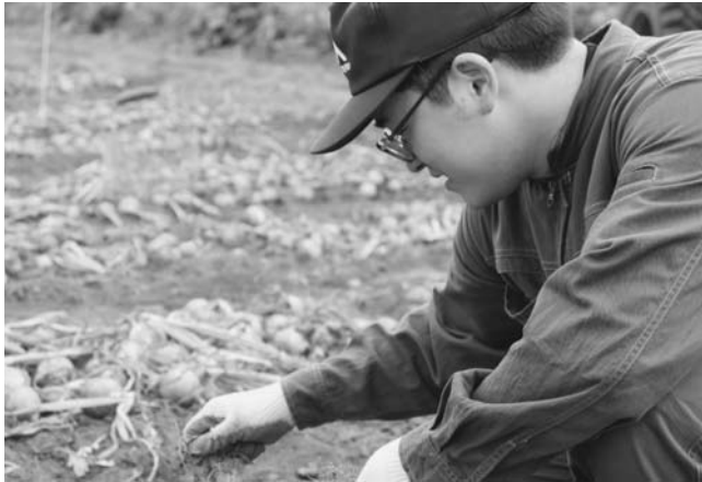
玉ねぎの収穫作業の様子

今回、当JA役員4名に農家研修の協力をいただき、研修を受けた職員に取材をしました。