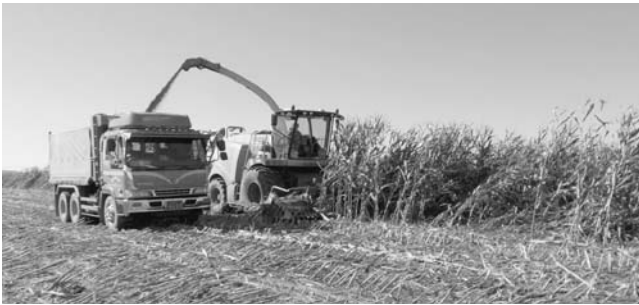
コントラ収穫の様子