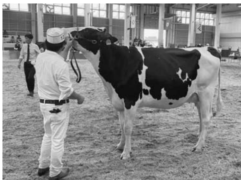
サニーライズ ウインド マイフアス レベツカ

また、この共進会の結果により第3部並びに第14部出陳牛は、9月28日に安平町で開催の2024北海道ホルスタインナショナルショウへの出陳が決まりました。審査結果は下記の通りです。