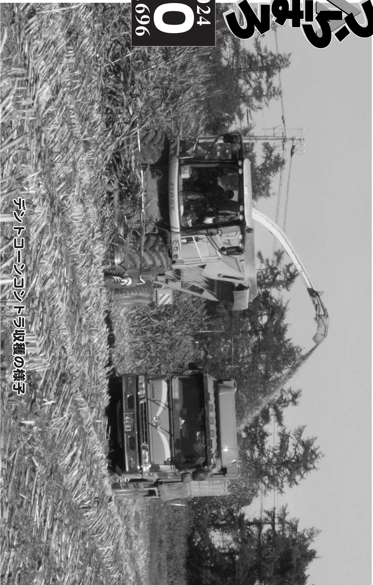
デントコーンコントラ収穫の様子