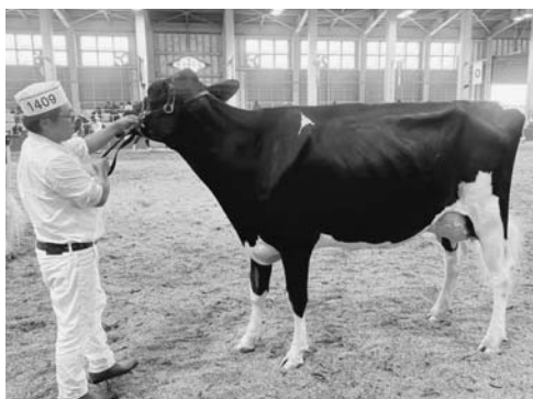
サニーライズ ハッピー ラム エクストリーム