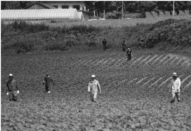
共同抜き取りの様子（川流布地区）