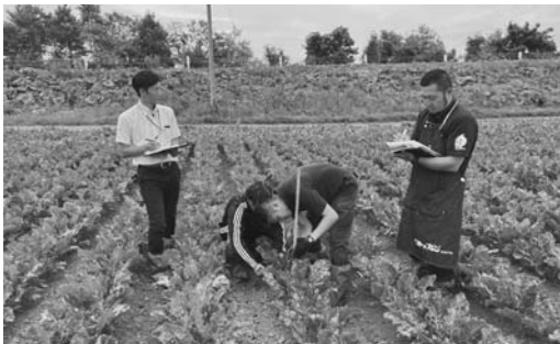
てん菜ほ場での視察の様子