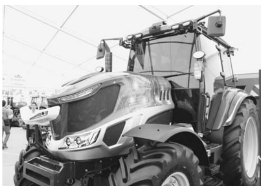
農機展用に出品されたロボットトラクター

会場内では、井関農機株式会社初の公開となる123馬力のロボットトラクターが展示されており、デザインはもちろん、スマホやタブレットを用いて作業を行