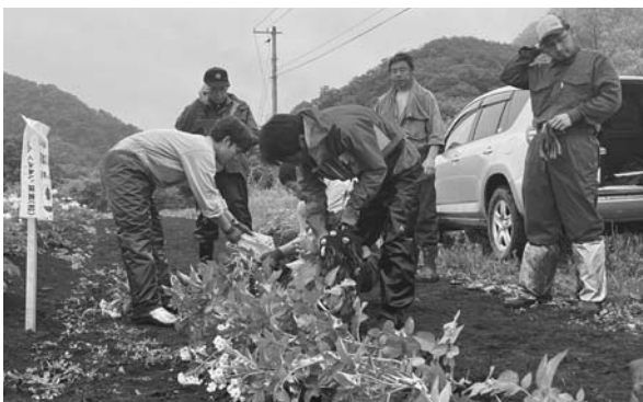
抽出した種子馬鈴しょ