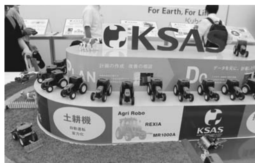
模型を用いた機械説明の様子

なう無人操縦システムに近未来や、技術の進歩とAIを活用した省力化の実現に可能性を感じました。