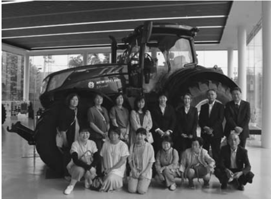
日本ニューホランド(株)での集合写真