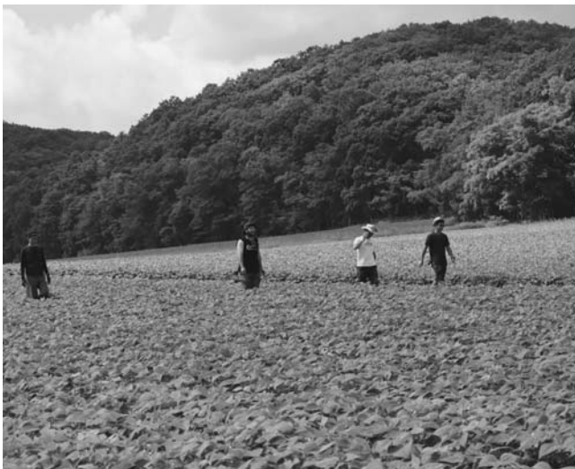
共同抜き取りの様子（相川地区）