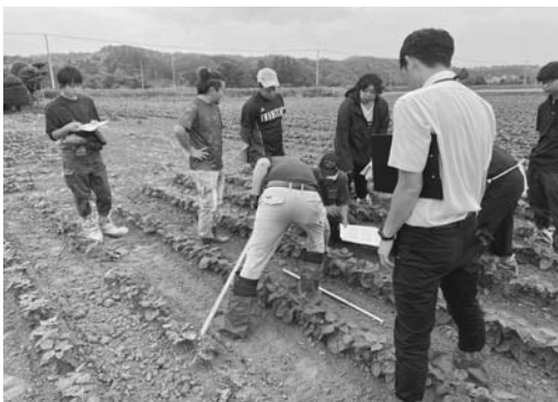
金時ほ場での視察の様子