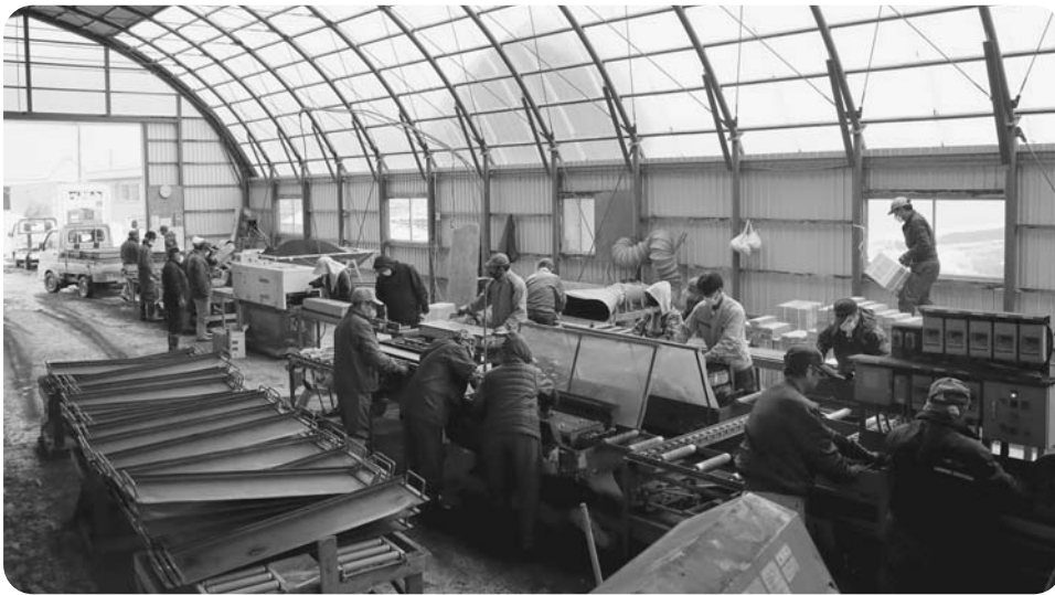
中浦幌てん菜播種センター組合