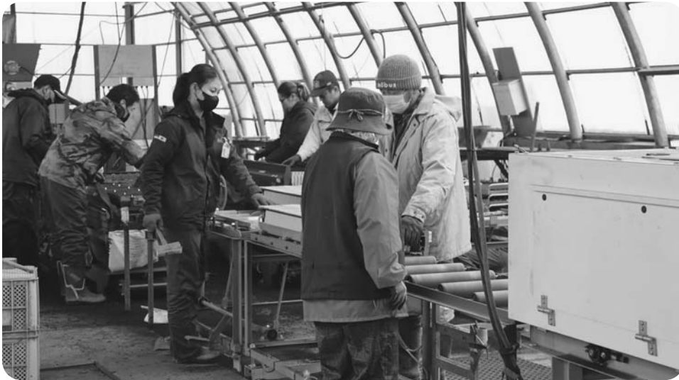
共栄てん菜播種センター組合