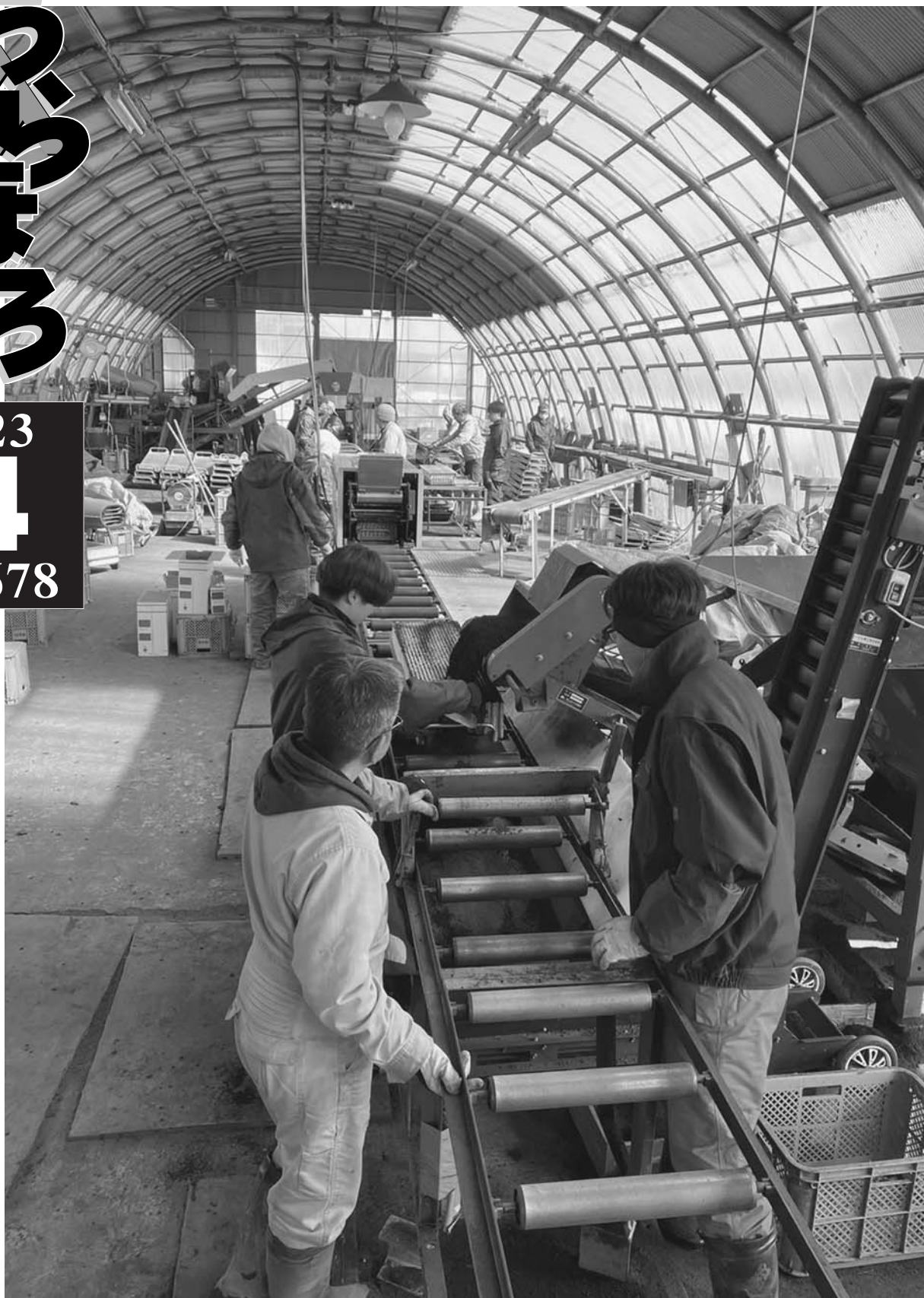
「共栄てん菜播種センター組合」稼働