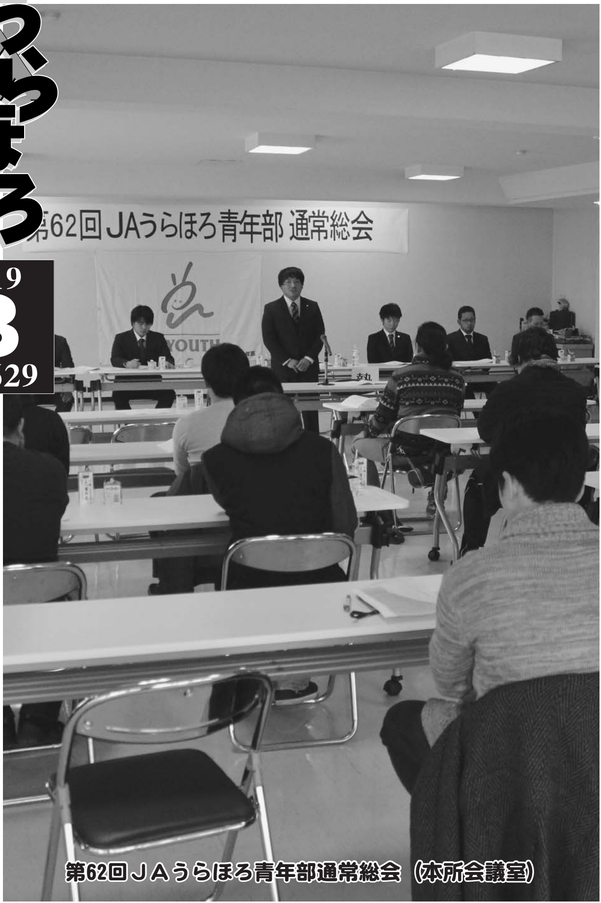
第62回 JAうらほろ青年部通常総会 (本所会議室)