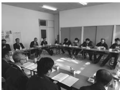
懇談会の様子（下浦南）

農協では懇談会での意見・質問について理事会で検討し、改善や対応を図って参ります。また、主な内容は次回の「くみあいだより」でお知らせいたします。