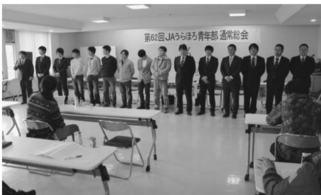
新旧役員挨拶の様子