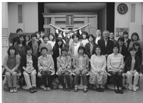
雪印メグミルク(株)にて

2日目は雪印メグミルク(株)酪農と乳の歴史館(札幌市苗穂)を視察しました。創業時に生乳からバターやチーズなどへ加工するために使用していた機械や製造ラインの動く小型模型が多数展示されていたほか、現在までのポスターや製品パッケージも展示されており、古い機械に驚いたり過去のポスターを懐かしみながら説明を受けていました。