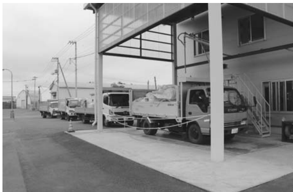
どれくらいの量があるのかを量り…