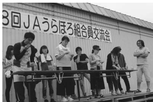
チーム対抗早食い競争

り浦幌産牛肉を提供していただき、焼台に花を添えました。また、昨年引き続き緑日風にかき氷とポップコーンの提供を行い好評でした。余興・イベントとして交流会の合間には新人職員の紹介やビンゴゲームを行った他、新たな企画として「チーム対抗早食い競争」を開催し、兄弟経営チームをはじめ4組の男女チームに参加していただきました、なかでも女性だけで編成された「チーム同級生」が健闘し2位に入賞し、大変盛り上がりしました。