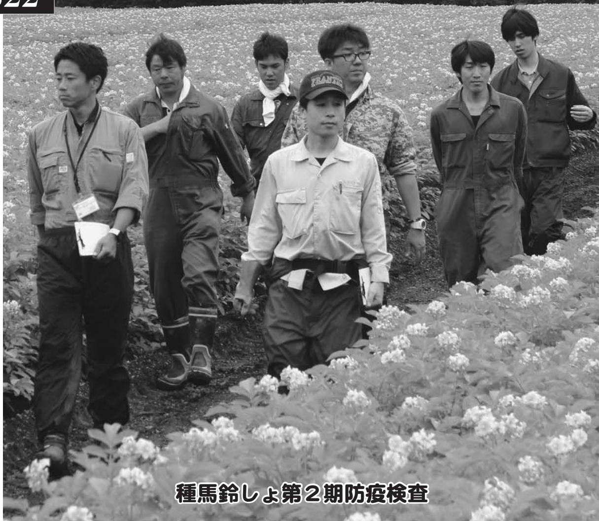
種馬鈴しょ第2期防疫検査