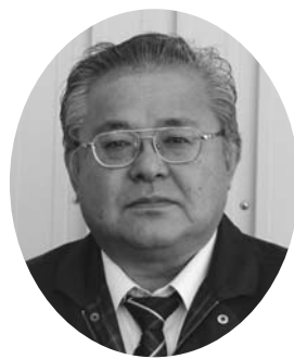
元総務部貯金共済課