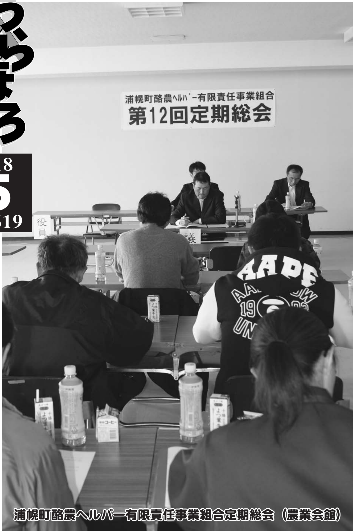
浦幌町酪農ヘルパー-有限責任事業組合定期総会 (農業会館)