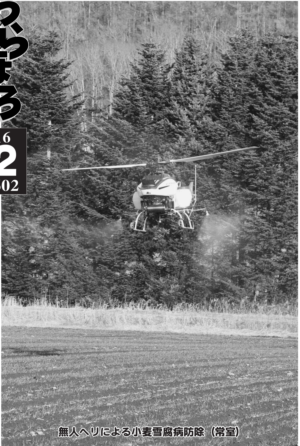
無人ヘリによる小麦雪腐病防除 (常室)