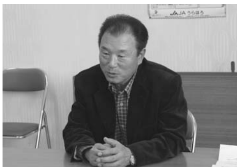
角田購買専門委員長

に代表される地方産業が創生されると思われません。今だからこそ、地域に根差し実情に合わせた地域JAゆえの購買事業の取組が求められる時代にあると思われず。