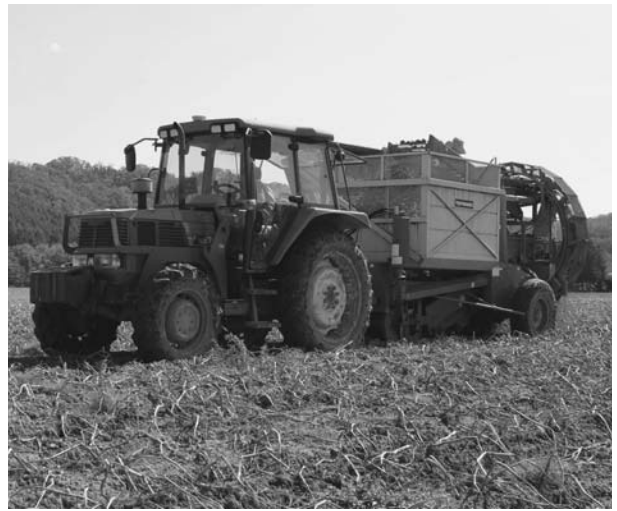
ポテトハーベスターによる収穫(常豊)