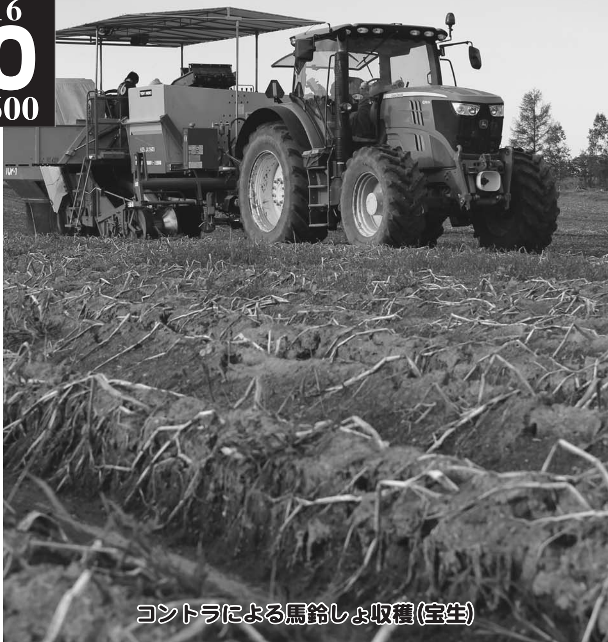
コントラによる馬鈴しょ収穫(宝生)