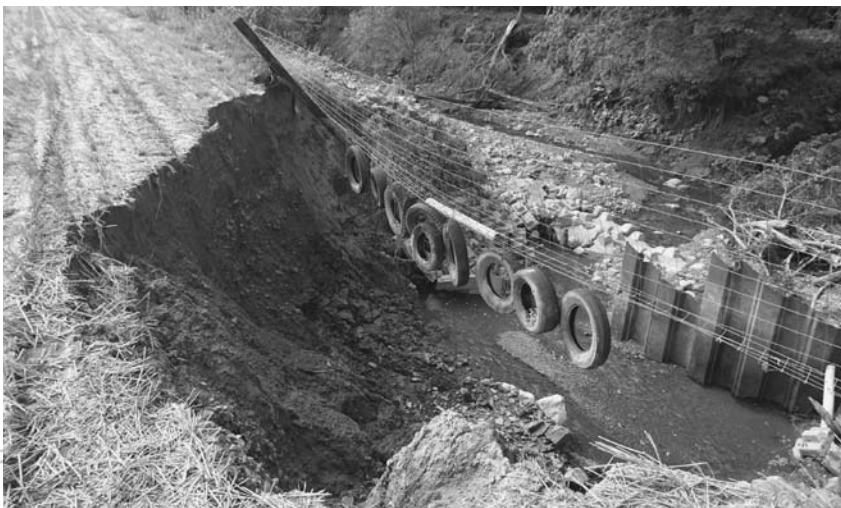
台風により崩れ落ちた地面